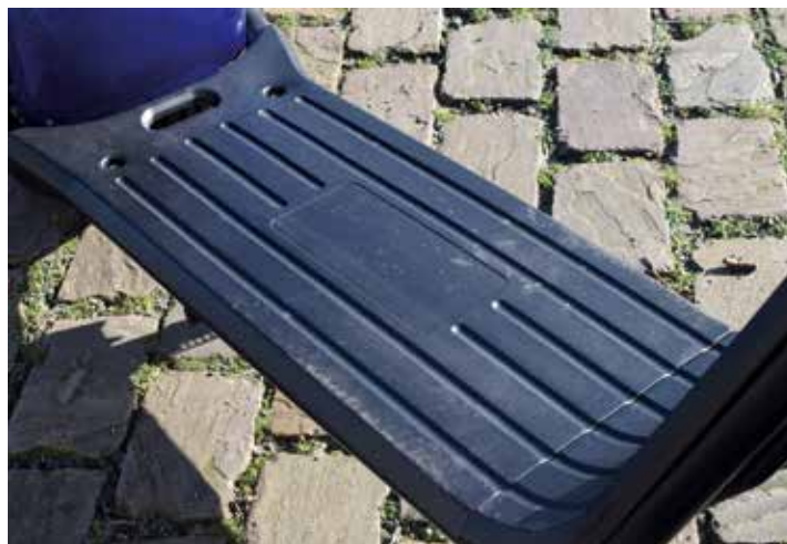
Ruime treeplank, hieronder schuilt de accu en oplaadpunt

(of op je werk) toch weer aan de lader. Van volledig leeg naar vol gaat in 5 tot 7 uur en de lader aansluiten is erg gemakkelijk. Je moet wel even