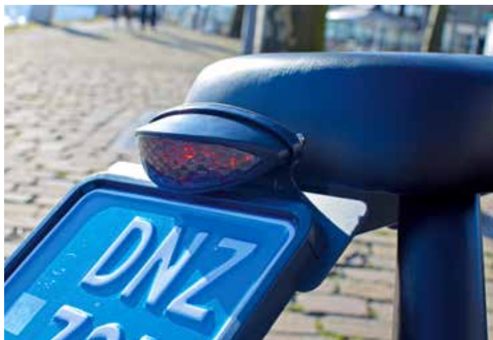
Fraai LED achterlicht