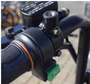
Knipperlichten zitten er niet op