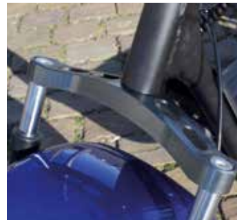
De meeste demping komen uit de banden en de voorvork