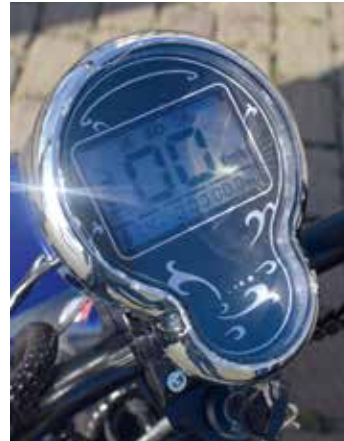
Duidelijke digitale snelheidsmeter

maken, voor een geringe meerprijs. Tegen meerprijs zijn er ook nog meer accessoires voor de RubRider leverbaar. Zo is er een duozadel, lederen zadel, een tas en een track&trace systeem leverbaar.