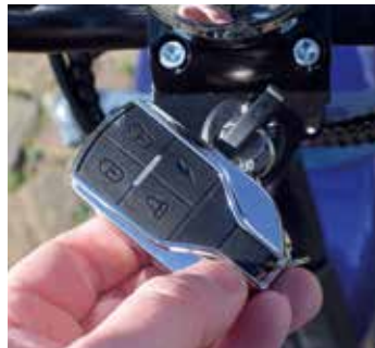
Een alarm is standaard