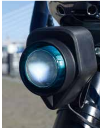
Brengt meer lichtopbrengst dan je zou verwachten!

Dit keer gaan we niet op stap met een scooter of een motorfiets. De RubRider die we onder de aandacht brengen weegt slechts 60kg rijklaar en is volledig elektrisch. Voor we hem technisch nader onder de loep nemen, kijken we nog eens goed naar het uiterlijk. Inderdaad het heeft wel iets van een step, maar volgens de vertegenwoordigers van RubRider zouden we er ook een Harley-Davidson in moeten herkennen. Die vergelijking gaat misschien wat ver, maar natuurlijk snappen we dat het moeten zoeken in de spatborden, de wielen en het stuur wat qua afmetingen inderdaad zomaar op een Harley had kunnen zitten... Onze demo voor deze week is voorzien van blauwe spatborden en dat zou ook zomaar onze persoonlijke keuze kunnen zijn geweest. Maar smaken verschillen (gelukkig) en daarom zijn de spatborden in een legio aan verschillende kleuren en designs te krijgen. Wij kunnen ons goed voorstellen dat de RubRider een leuk reclameobject zou kunnen zijn. Geen probleem, want ook bedrijfslogo's of bepaalde uitingen kunnen in het ontwerp van de spatborden worden meegenomen. RubRider werkt samen met een leverancier die wraps op maat kan