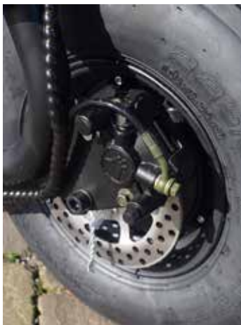
Ook aan de achterkant een schijfrem