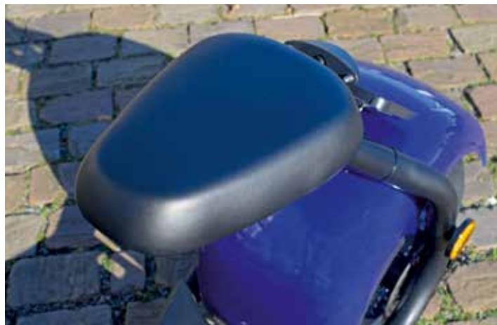
Er is optioneel ook een duozadel leverbaar